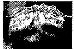
[写真: マチ付ききんちゃく袋]